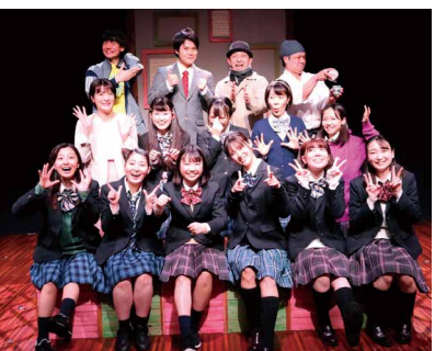
『よろこびの歌』の出演者たち。一年の延期を経て、コロナ禍という困難な会期を全員で乗り切った。

いつ延期が決まったのですか？ 2020年、ちょうど日本で初めて新型コロナウイルスの感染者が見つかった、そんな時期に稽古をしていました。主宰する立