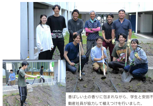
香ばしい土の香りに包まれながら、学生と安田不動産社員が協力して植えつけを行いました。

ワテラススチューデントハウスの中庭を菜園として活用するプロジェクトが始まりました！今年は、さつまいもの栽培・収穫にチャレンジします。5月末に実施した第1回目の活動では、草むしりから苗の植えつけまでを行いました。収穫した野菜を地域に還元することを目標に活動を継続します。