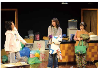
第4回目の公演『片づけた女たち』の様子。

続編『終わらない歌』を、翌年すぐに上演しなかったのですね。4回目は違う演目をやったそうですが、なぜですか？