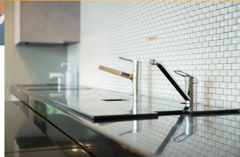
ナチュラルカラーの家具に加え、新たに植物を取り入れることで、広場との一体感を演出した。IH付きキッチンも引き続き利用することができる。