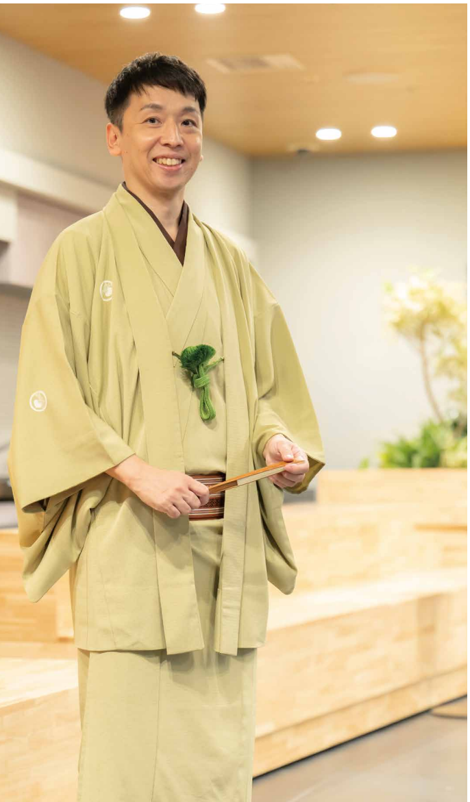
文○山本ヨウコ 校正○箱山康子

「もがく姿に人間らしさや愛らしさを感じるのが、落語の好きなところ」と語るのは、落語家としてだけでなく、国民的大喜利番組の新メンパーとしてテレビでも活躍する立川晴の輔さん。25年1月にワテラスコモンホールでの落語会を控える晴の輔さんに、これまでの道のりや落語の魅力について伺いました。